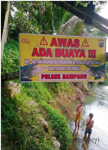
Polsek Hampang memasang peringatan tanda bahaya serangan buaya agar warga sekitar waspada berkegiatan di sungai

Di sisi lain, munculnya monyet yang berkumpul di pemukiman juga menciptakan keresahan sekaligus tantangan baru.